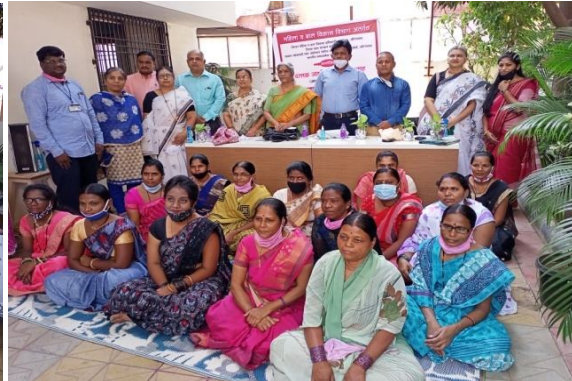
दत्तक जाणीव जागृती सप्ताह समारोप समारंभ बाल कल्याण समिती व जिल्हा बाल संरक्षण अधिकारी यांच्या उपस्थितीत संपन्न झाला