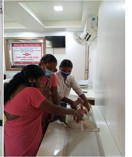
अंगणवाडी सेविका बालकांचे वजन व उंची कसे घ्यायचे हे समजावून सांगतांना