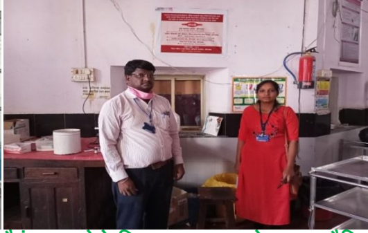
शासकिय वैद्यकिय महाविद्यालय व रुग्णालय (घाटी), औरंगाबाद येथे निराधार/अनाथ/बेवारस/ जैविक पालकांनी सोडून दिलेले/परित्यागीत बाळ/बालक सापडले किंवा एखादी कुमारी माता/गरोदर माता/विधवा माता तीला बाळ नको असेल तर आपण आमच्याशी संपर्क करून त्यांची मदत करू शकता अश्या फलकाचे अनावरण